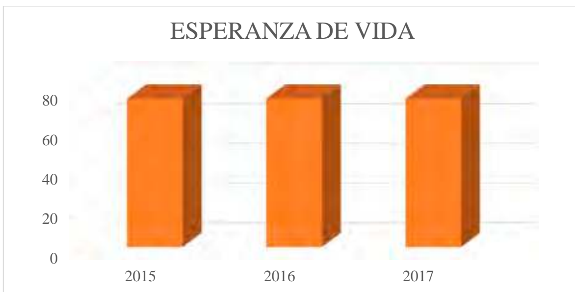
Figura 01. Grafica del Indicador Nivel Fin Denominado “Esperanza de Vida”. En la siguiente Grafica, se observa que el indicador “Esperanza de Vida” se ha mantenido constante con un dato de 75.25 años de edad.

A continuación, se muestra en forma gráfica un estudio analítico con datos estadísticos para verificar como estos indicadores y sus resultados, han evolucionado a lo largo de su implementación. Esto se realiza con el fin de poder tener una idea del camino que estos deberán seguir al estudio. Véase Figura 01.