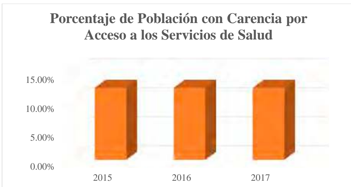
Figura 02. Grafica del Indicador Nivel Fin Denominado “Porcentaje de Población con Carencia por Acceso a los Servicios de Salud”.

La Población con Carencia por Acceso a los Servicios de Salud se mantuvo constante en los últimos 3 años de estudio. Véase figura 02.